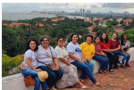
Comunidade da Casa de Formação em Olinda

Os alunos da Educação Infantil e Ensino Fundamental encheram de ternura, orgulho e alegria o coração das suas mães. Com o tema: "Mãe, Amor Divino", as mães foram recepcionadas com danças, corações, lembrancinhas, muita música e uma linda apresentação de alunas representando Nossa Senhora Auxiliadora. Tudo para demonstrarem o quanto elas são especiais para eles.