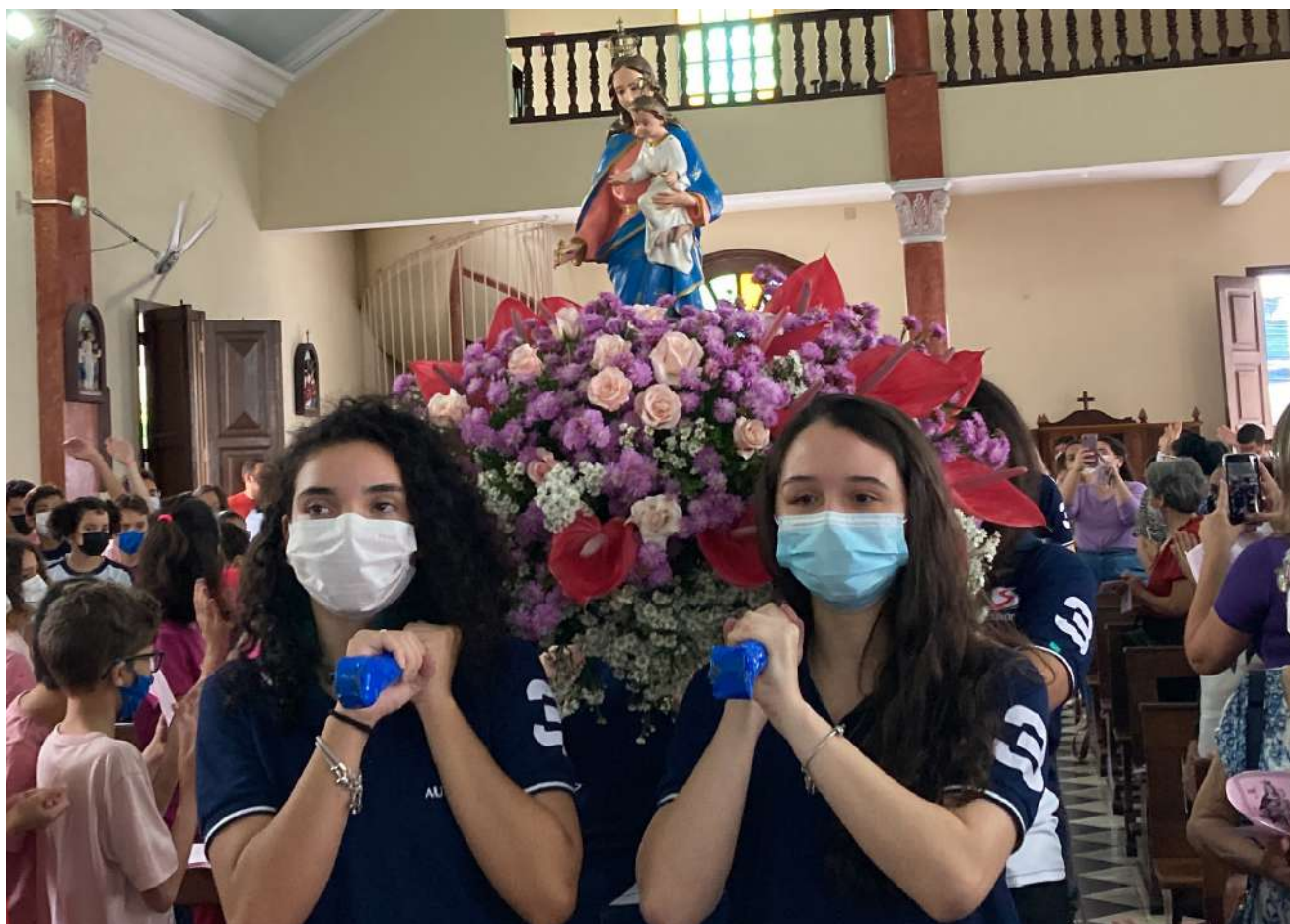
Alunas do Auxiliadora Recife carregam o andor de Nossa Senhora.